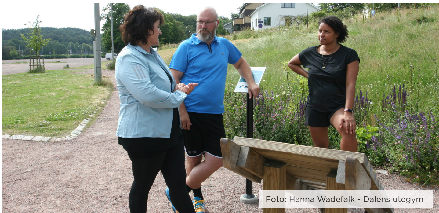
Dalens utegym