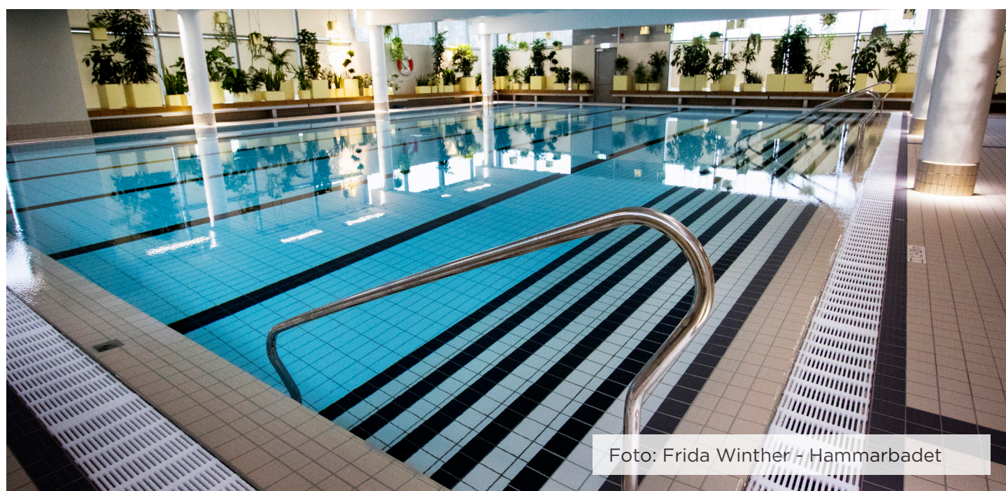
Hammarbadet